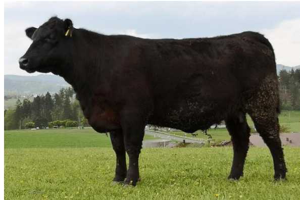
Craigowmill Blackbird T076

Sunderberg Braveheart V762 hat ein in Deutschland einzigartiges Pedigree, gespickt mit internationaler Leistungsgenetik. Er stammt von Carinthia Ecstasy T938, ein Carinthia Dark Devil Sohn, der in Österreich alle jemals aufgezeichneten Rekorde (2035 g / 1994 g) gebrochen hat. Dark Devil ist ein Sohn des bekannten Überbullen Rawburn Black Hawk , verkauft für 40.000 Pfund und damit teuerster Jähringsbulle überhaupt in Schottland und wahrscheinlich weit darüber hinaus. Nachkommen von Rawburn Black Hawk sind in Schottland absolute Verkaufsgaranten und auf den Schauen/Auktion sehr gefragt. Die Mutter von Ecstasy ist Carinthia Elaine , Siegerin St. Donat, aus typvoller neuseeländischer Abstammung – Highlander of Stern. Ecstasy T938 ist die gewünschte Kombination seiner Eltern mit bestechender Leistung (1.680 g/1510 g) und hervorragenden Typeigenschaften.