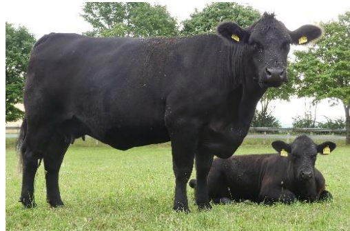
Blackcap S248 vom Mittenhof