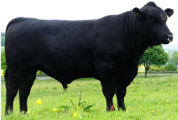
Carinthia Ecstasy T938